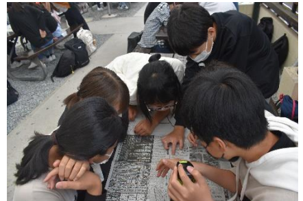
【雨の日レクに取り組む様子】

焼きそば作りでは、火をつけるのに苦戦した後、ようやく火がつき、本格的な焼きそば作りが始まった。大変だったけど、あきらめずに協力して、みんなで頑張って焼きそばができた。本当に楽しかった。