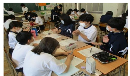
【友人の意見に拍手】