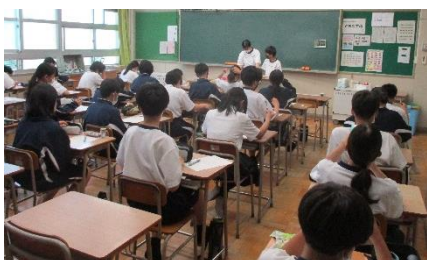
【室長が進行役です】

当日は、室長を中心に活発な話し合いが行われ、有意義な時間とすることができました。印象的であったのが、「自分の学級を良くしたい」という姿勢が、どの学級からも感じられたことです。あと少しで夏休み。「この学級でよかった」と感じられるような、1学期の締めくくりになることを期待しています。